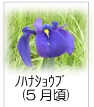
ハナショウブ (5月頃)

Eメール: syakaibunkazai@city.yokkaichi.mie.jp