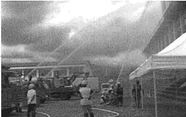
住民参加の放水訓練