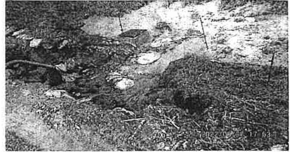
桜西地区：土手崩れ