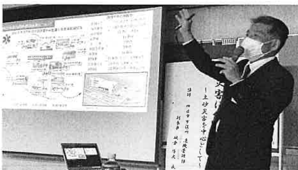
ジェスチャーたっぷりのお話し