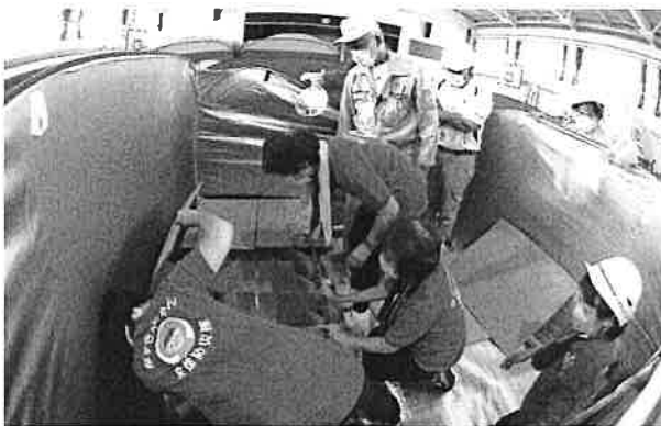
桜ずきんちゃんによる簡易トイレ準備