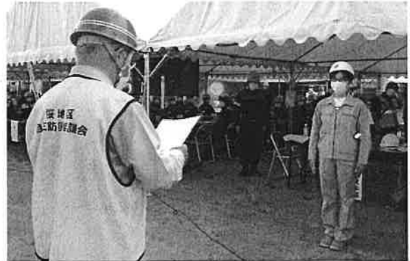
市民センターへ安否状況報告