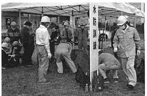
住民参加の水防訓練