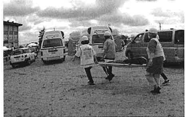
住民参加の救出訓練