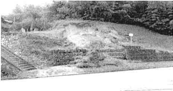
山上地区：地蔵堂北東斜面